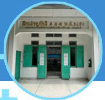
อาคารเสริมภูมิคุ้มกัน